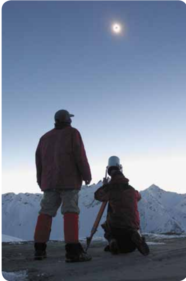
Охотники за затмениями — участники научной экспедиции «Корона 2006» в Приэльбрусье.

имеют возможность наглядно убедиться в этом, наблюдая солнечное затмение, когда темный диск Луны с изумительной точностью закрывает ослепительный солнечный шар.